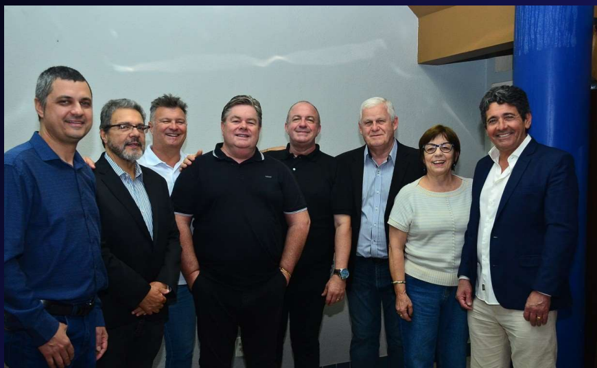
DIRETORIA - GESTÃO 2023-2024